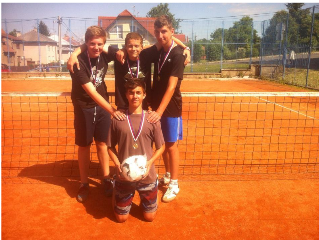
Vítězné družstvo chlapců v krajském kole v nohejbale