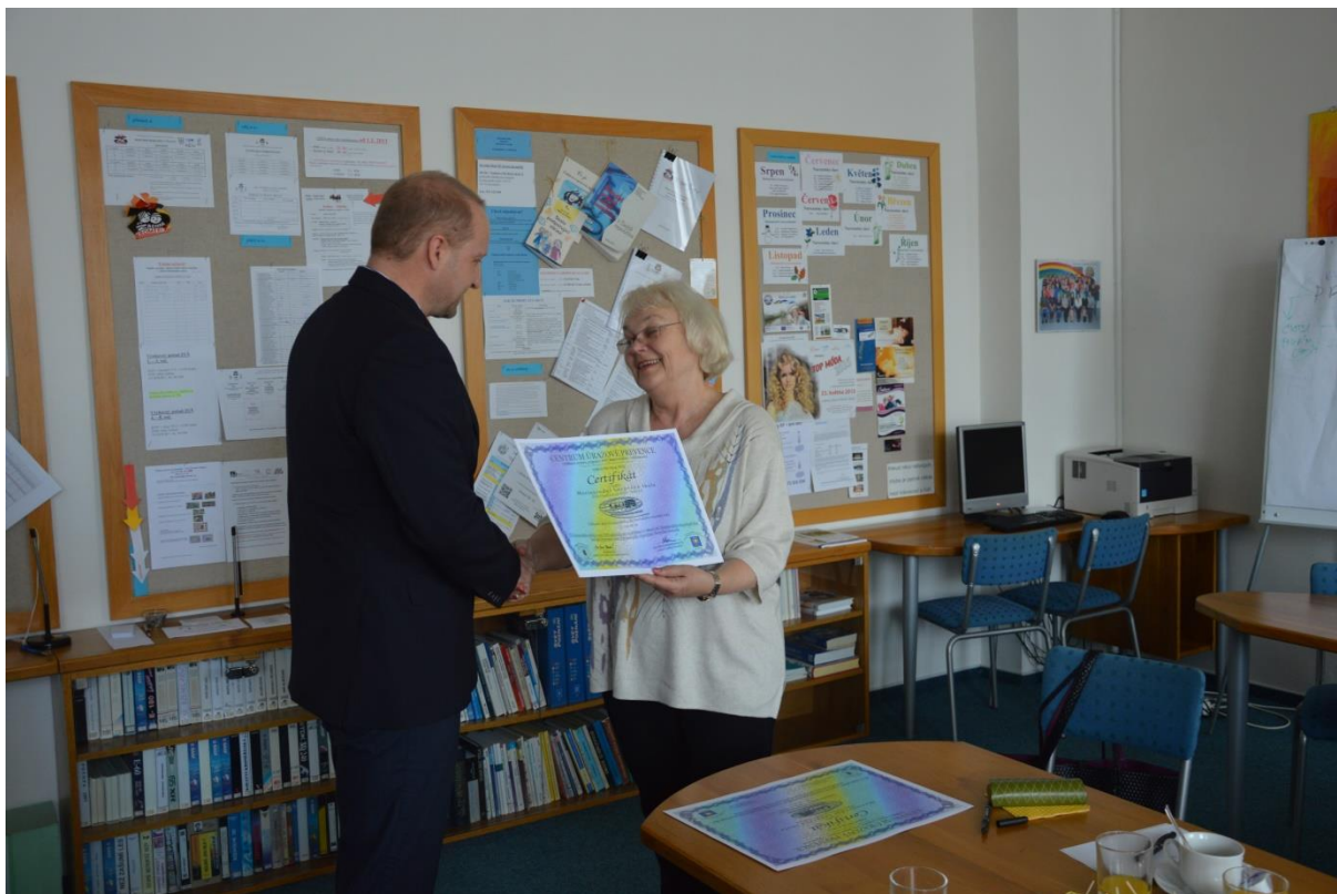
Slavnostní předávání certifikátu Mezinárodní bezpečné školy

počínat nebo přivolat pomoc při úrazu nebo mimořádné události. Na 1. stupni celoročně pracoval zájmový dopravní kroužek. V měsíci květnu byl pro žáky 1. stupně úspěšně realizován projektový den Kolo je můj kamarád . V 6. ročníku byly realizovány projekty Třídní klima a Přátelství, tolerance, dobré vztahy . Ve školní družině byl dále rozvíjen celoroční projekt Bezpečná školní družina , který je orientovaný na osobní bezpečí a předcházení úrazům ve školní družině i mimo ni. Plán činností a aktivit se odvíjí od možných rizik v jednotlivých ročních obdobích. V průběhu školního roku byla realizována řada aktivit v úzké spolupráci zejména s Policií ČR a dopravním hřištěm.